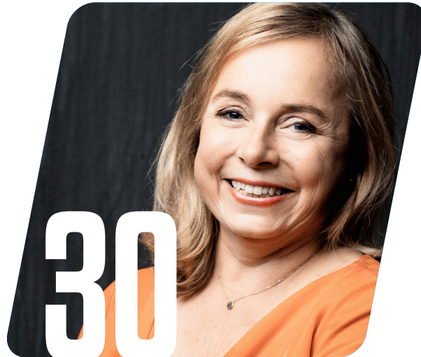
Kunst Schauspielerin Christine Urspruch im Porträt