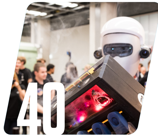
Wissenschaft Weltraumrobotik im Fokus